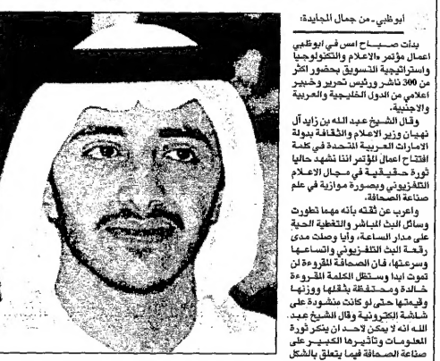
عبد الله بن زايد في افتتاح مؤتمر الإعلام والتكنولوجيا

عبد الله بن زايد في افتتاح مؤتمر الإعلام والتكنولوجيا عبد الله بن زايد في افتتاح مؤتمر الإعلام والتكنولوجيا عبد الله بن زايد في افتتاح مؤتمر الإعلام والتكنولوجيا